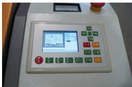
Particolare PLC comandi